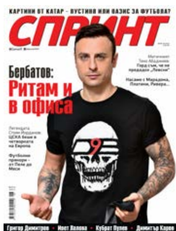
СПРИНТ 10 000 тираж