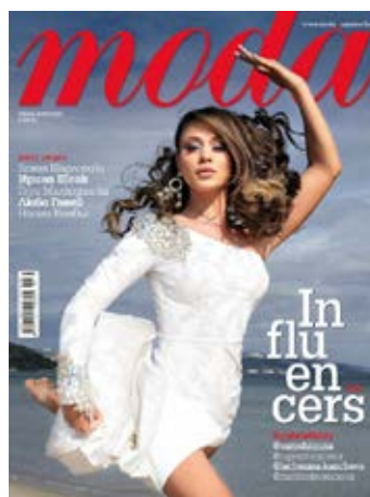
MODA 7000 тираж